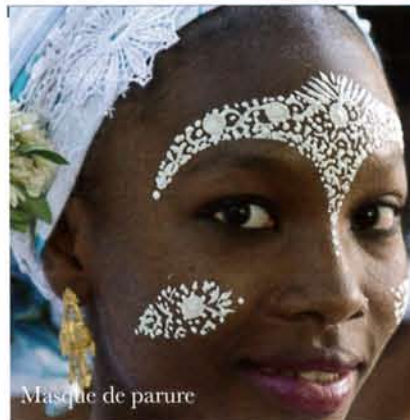
Masque de parure