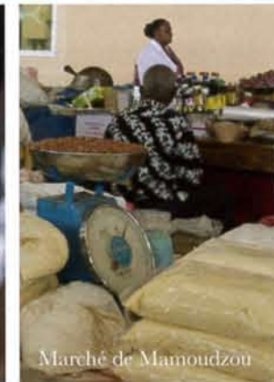
Marché de Mamoudzou